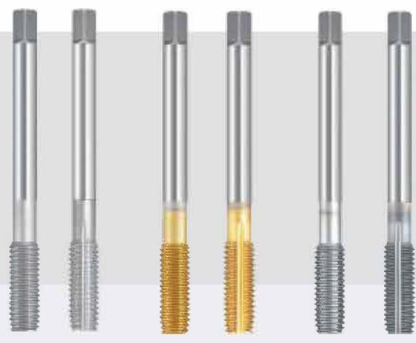
uncoated TIN coated TiCN coated

Internal thread shaper type VA for rust-free materials and steels with high strength